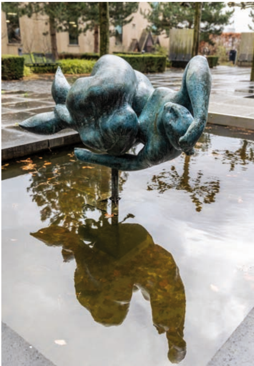
9. Kantoor van Brabant Water in Breda op het bedrijventerrein Minervum. Achterzijde van het complex met de boven het water zwevende zeemeermin.