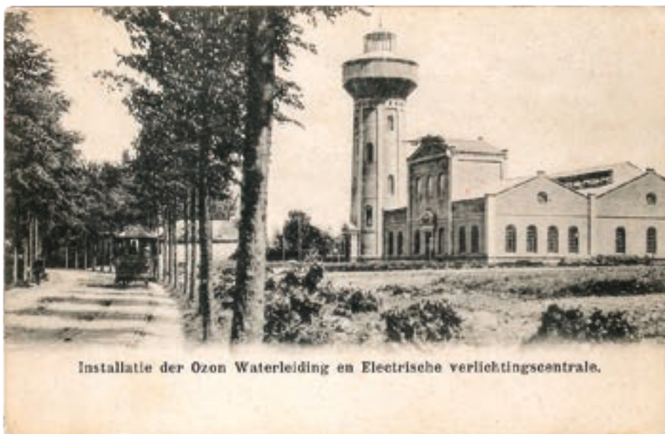
Installatie der Ozon Waterleiding en Electriscbe verlichtingscentrale.

De ontwikkeling van waterleidingsystemen komt daarom in de buurgemeenten pas veel later op gang. Het verstedelijkte en welvarende Ginneken is het eerst aan de beurt. Deze gemeente krijgt in 1904 een eigen waterleiding- én elektriciteitsbedrijf met een heuse watertoren in Ulvenhout. Het water komt uit de rivier de Mark en wordt gezuiverd door zandfiltratie en ozon. Het is een private onderneming, maar het merendeel van de aandelen is in handen van de gemeente. 7 Een jaar na de opening is de onderneming al failliet door de hoge opstartkosten en de te lage prijzen die het bedrijf mag rekenen voor het geleverde water. 8