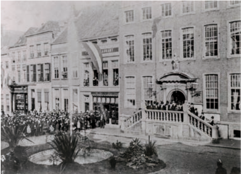
1. Fontein op de Grote Markt van Breda bij de opening van de waterleiding op 15 februari 1894. (Stadsarchief Breda (SAB), 19870392)