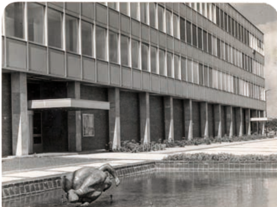
8a. Gezamenlijk kantoor van WNWB en ENWA Breda aan de Doornboslaan 39 geopend in 1967. Op de voorgrond in de vijver het beeld de Zeemeermin van Joop Hekman. Eind 2005 wordt dit kantoor gesloopt na de verhuizing naar Minervum. (SAB, Ben Speekenbrink ca. 1970, 19922906).