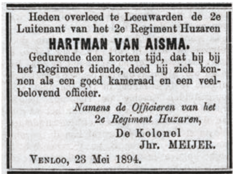
7. Overlijdensbericht Hartman van Aisma in de Venloosche Courant 26 mei 1894.

Er behoeft niet gezocht te worden naar mooi klinkende frases, 't is met eenvoudige woorden te zeggen, hoeveel we van hem hielden; hij was zelf zoo'n eenvoudige, hartelijke, trouwe ziel! 70