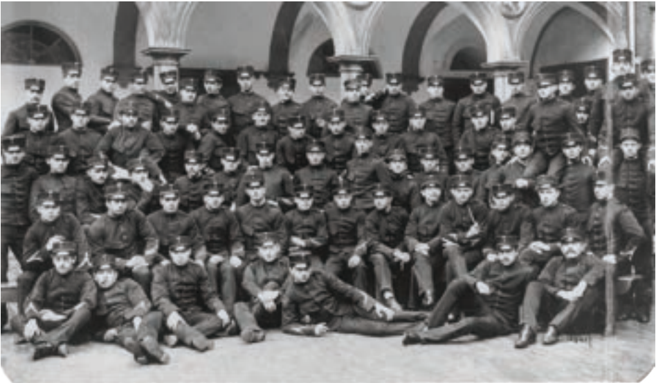
4. Groepsfoto van cadetten van de KMA. Fotoboek 1890.