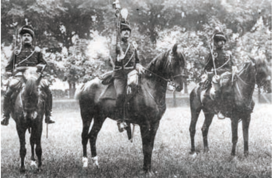
6. Cavaleristen van het Tweede Regiment Huzaren in Venlo, 1908.