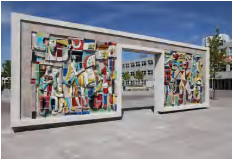
10. Hugo Brouwer, z.t., 1959, keramisch reliëf herplaatst als poort.