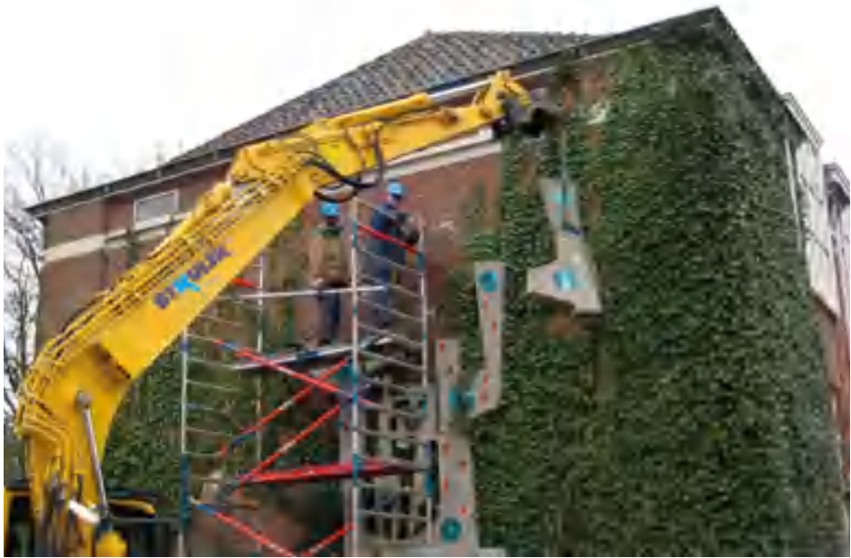
8. 'De Levensboom' wordt verwijderd van de gevel van Heuvel 100.

projectleider deze toezegging. Daarna volgde een lange zoektocht naar een andere geschikte locatie: die werd uiteindelijk gevonden. De Vereniging van Eigenaren van een woningcomplex aan het Dr. Struyckenplein-Magelhaensstraat wilde het kunstwerk herplaatsen tegen de kopse kant van het woonblok dat slechts enkele honderden meters aflag van de oorspronkelijke plaats: de huishoudschool Regina Pacis. Het woningblok was bovendien ontworpen door architect Peutz en stamde dus uit dezelfde tijd als het kunstwerk. Terwijl dit buitenkunstwerk probleemloos meer dan vijftig jaar met dokken (speciale bouten) bevestigd had gezeten tegen de muur van de voormalige school, was nu, vanwege de inmiddels strengere eisen voor plaatsing, een stalen constructie vereist. Restauratie Breda restaureerde het werk voordat het in het stalen frame geplaatst kon worden. De negen delen van het kunstwerk waren vervaardigd van beton, dat door Neijens in door hemzelf gemaakte bekistingen was gegoten. Alleen het middengedeelte, man-vrouw-kind, was met betonijzer gewapend en dit was gaan roesten en uitzetten. Het oorspronkelijke betonijzer werd vervangen. De overige delen waren nauwelijks aangetast: er ontbraken slechts enkele stukjes van de ingelegde gekleurde glaspatronen. 'De Levensboom' werd op 5 februari 2014 onthuld.