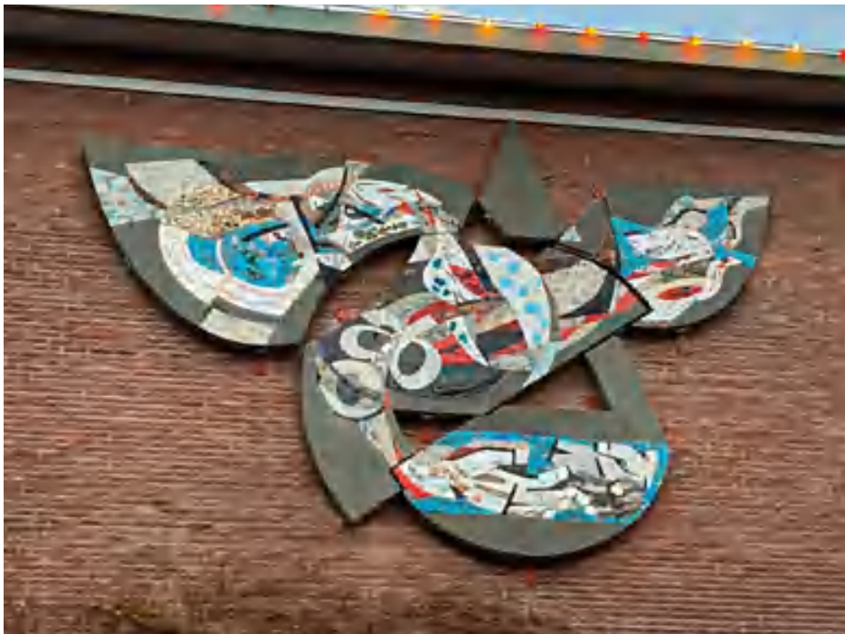
2. Gé Verhulst, 'Vorming, creatie en verkoopkunde', 1963, gemengd mozaïek afkomstig uit het voormalige Van der Puttlyceum in Eindhoven en op 17 december 2020 herplaatst tegen Het Ketelhuis, Strijp-S in Eindhoven.

De hierboven al genoemde schaarste aan (bouw)materialen in de eerste jaren na de oorlog noodzaakte de beeldend kunstenaars inventief te zijn bij de vervaardiging van hun werken. Er ontstonden kunstwerken die zich wat materiaalgebruik en techniek betreft duidelijk onderscheidden en die nu kenmerkend voor de wederopbouwkunst worden genoemd. Beton was in ruime mate voorhanden. Er ontstonden naast betonnen kunstwerken ook glas-in-betonramen waaruit soms volledige wanden, onder meer in