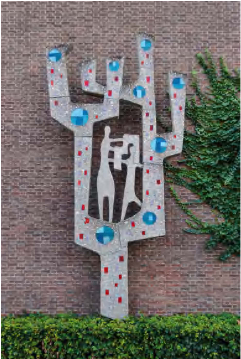
7. Fons Neijens, 'De Levensboom', 1952.