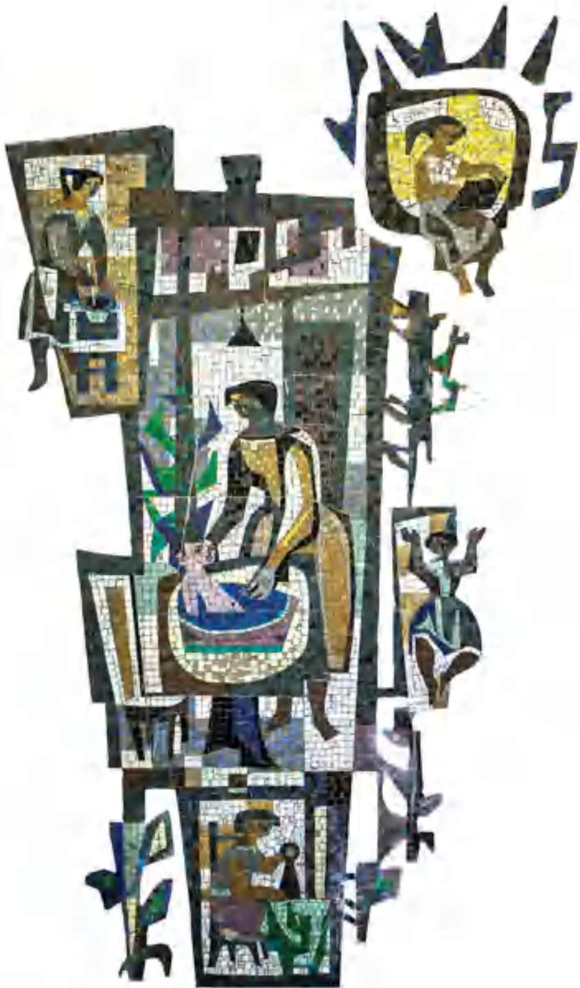
9. Piet Buys, 'De meisjes van de Heuvel', 1952, glasmozaïek.